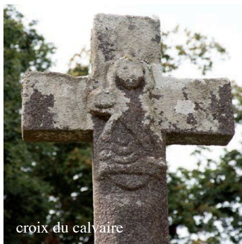
croix du calvaire

Le calvaire, sur le placître, est élevé sur quatre marches et porte une piéta sculptée dans la pierre.