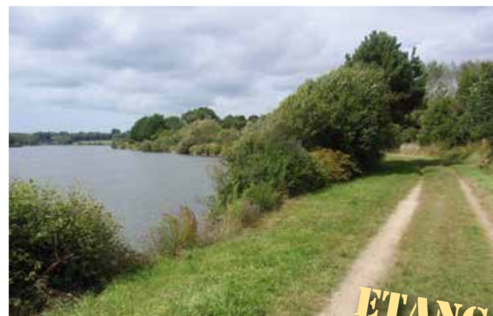
ETANG DU TOUL DOUR

De petits ouvrages topo-guides vous conduiront à partir de là vers d'autres chemins à la découverte des