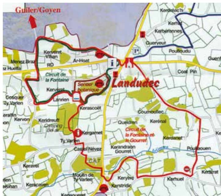
plan en pdf sur internet ou en mairie